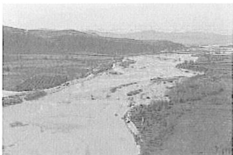
WhatsApp Image 2026-03-07 at 20.44.26 (1).jpeg 135K